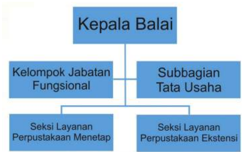
Gambar 2.2 Struktur Organisasi Balai Layanan Perpustakaan Ghratamapustaka

Subbagian Tata Usaha mempunyai tugas melaksanakan kearsipan, keuangan, kepegawaian, pengelolaan barang, kerumahtanggaan, kehumasan, kepustakaan, serta penyusunan program dan laporan kinerja. Untuk melaksanakan tugas sebagaimana dimaksud Subbagian Tata Usaha mempunyai fungsi: